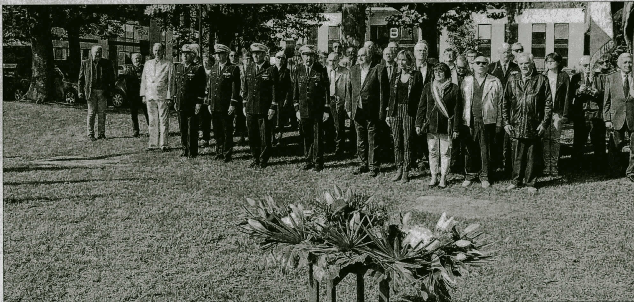
Les anciens de l'armée de l'air sont toujours fidèles à cette commémoration qui est un lien social entre anciens militaires.

Après les dépôts de gerbes, la minute de silence et "La Marseillaise", la municipalité du Bourget-du-Lac a invité les participants à un moment de partage à La Traverse.