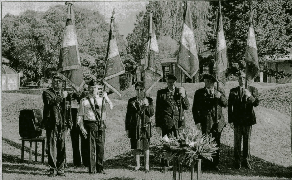
Une douzaine de porte-drapeaux ont participé à cet hommage à Georges Guynemer.